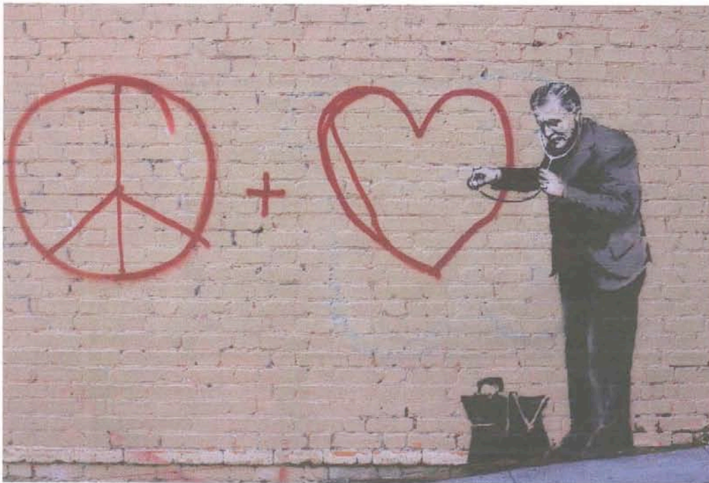
BANKS'S HJERTE I CHINA TOWN I SAN FRANCISCO.