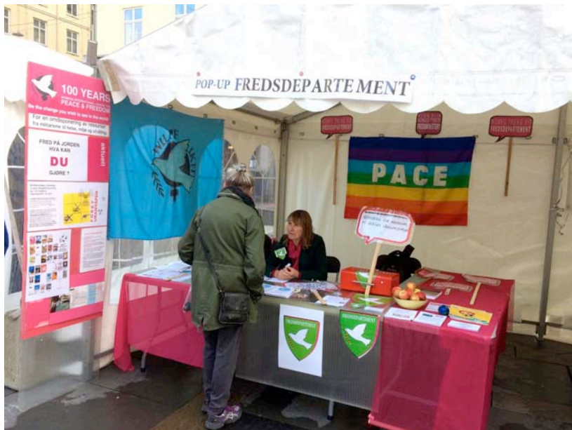
POP-OPP Fredsdepartement under Internasjonal Uke, Bergen oktober 2016