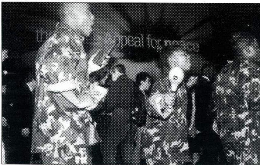
Dansende fra Sør-Afrika.