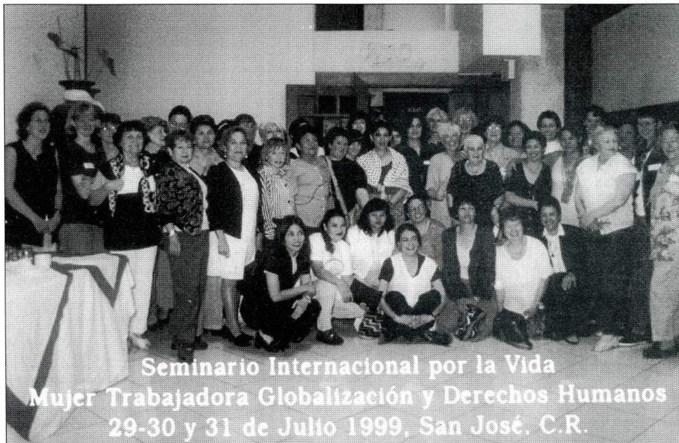
Seminario Internacional por la Vida Mujer Trabajadora Globalización y Derechos Humanos 29-30 y 31 de Julio 1999, San José, C.R.