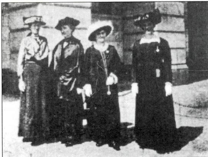
WILPF - delegasjonen i Norge

fornuftig fredsløsning på grunnlag av forslag fra hver av dem». I mai 1915 reiste to grupper av delegater til 14 europeiske land. De la fram forslagene for statsjefer og regjeringer, og for Paven. I Norge ble kvinnene mottatt i audiens hos Kong Haakon. Dette skjedde altså midt under den verste gass- og skyttergravskrigen.