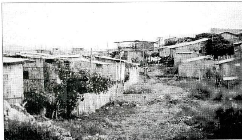
Slumstrøk i Equador

Skrevet av Guri Tambs-Lyche etter et manuskript av Berit Ås