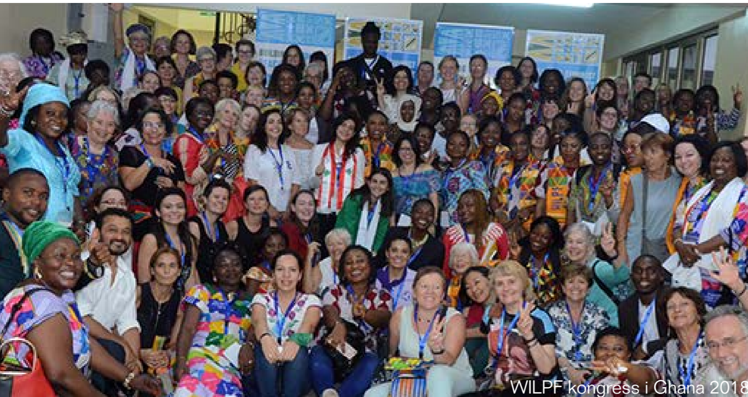
WILPF kongress i Ghana 2018

WOMEN'S INTERNATIONAL LEAGUE FOR PEACE & FREEDOM