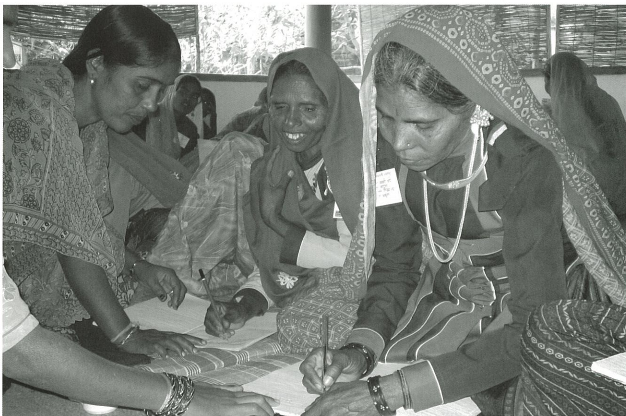
India har over en million kvinnelige folkevalgte. Det skal være flere enn i resten av verden til sammen! Her er tre av dem.

- India var det første landet som gikk til det skritt å "kaste ut" en masse giverland. De sa at dette med å ha en uendelighet av prosjekter og givere ikke var verdt det. Norge var en av de giverne som ble kastet ut. Men inderne kom etter hvert tilbake og sa at de kunne være interessert i prosjekter, men det måtte være gjensidighet. Noe av det mest positive med dette prosjektet er vektleggingen av gjensidig læring. Jeg tror dette vil være framtidens bistandsform.