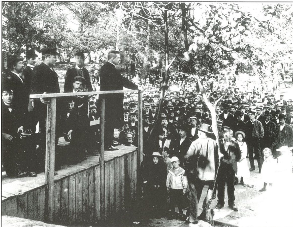
Unionsstriden skapte sterke følelser på begge sider av landegrensen. Den sosialistiske politikeren Hjalmar Branting taler i Sickla folkpark utenfor Stockholm i 1905. Han var den fremste talsmannen for en fredelig løsning på konflikten

Jugoslaviens-krigen, berøttede for mig att Norden var mykett omtyktt och beundrat i detta land. Samarbetet med Sverige i gruppen av neutrals och alliansfria l nder (NN-gruppen) hade medf rt att svenska milit rer h mtade kunskap om partisan-krigsf ring i Jugoslaviens og landet var en av de st rsta k parna av svenskt krigsmaterial.