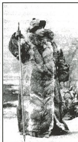
Kata Dalström på reise i Norrland

I 1905 ble også den frisinnete kvinnebevegelsen sterkt splittet, i en norskvennlig del, som fant det norske vedtaket ganske rimelig og en annen del som mente at nordmennene hadde fornærmet Sverige ved sin opptreden og at vedtaket var ulovlig. Blant de første var forfatterinnen Ellen Key (1848-1926). Hun var en meget ivrig fredsvenn og hadde allerede i 1898 holdt et foredrag i Karlstad der hun støttet nordmennene og gikk sterkt inn for fred mellom "brödrafolken". Dette førte til en meget opphisset debatt i