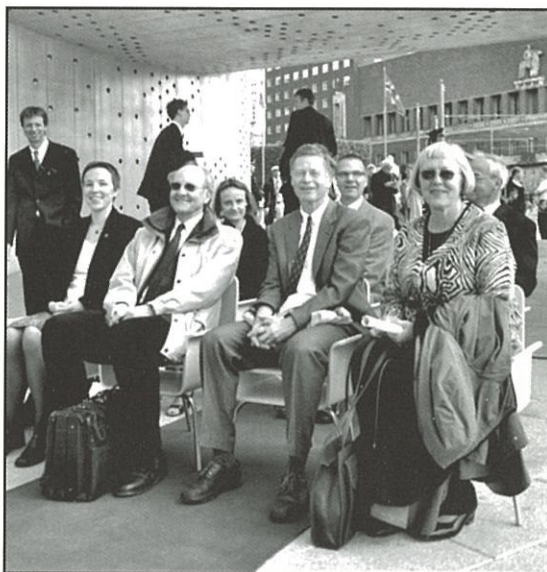
De fire innbudte fredsorganisasjonene. De sitter på de plassene de kongelige satt på!

stillingen. Neste år vil denne plassen gå videre til vinneren i 2005.