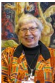
Torild Skard

Denne boka presenterer kvinner fra forskjellige deler av verden, som har vært delegater gjennom hele FNs historie, fram til vi fikk Sikkerhetsrådets resolusjon om kvinner, fred og sikkerhet.