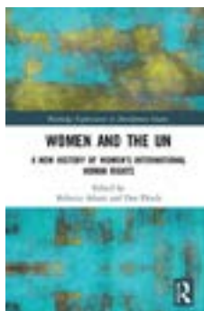
Boka Women And The UN